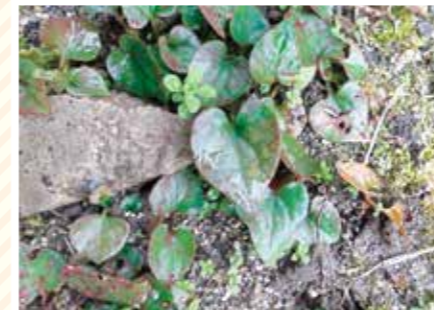
【ハート科】ハートのかさ