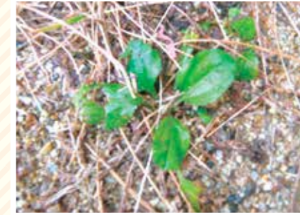
【まんまる科】まる草