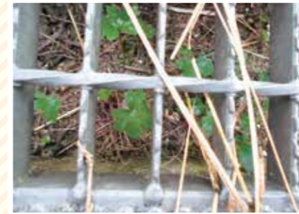
【さく科】さくの中の小さな草