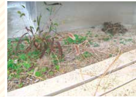
【ミドリ毛虫科】赤ふさ2きょうだい