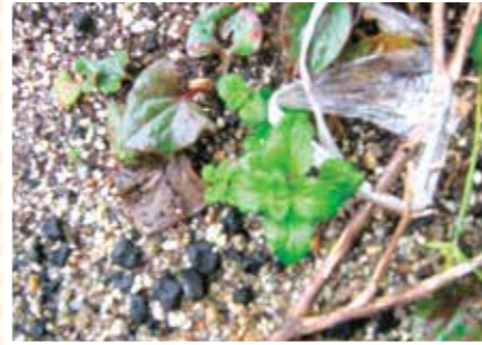
【ふたご科】ふたごクローバー