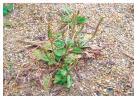
【ニョロニョロ科】へび草