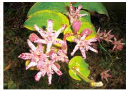
【ひとで科】ひとでくさ