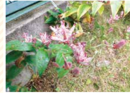
【つきみ科】スーパームーン