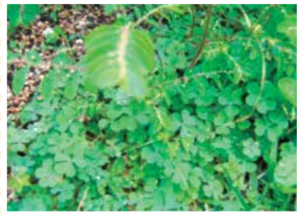
【ヤワラ科】フワフワ草