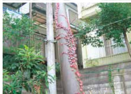
【クツキ科】電柱虫草