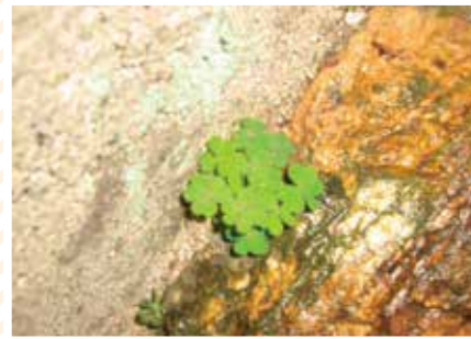
【ハート科】楽しいハート ワクワク草