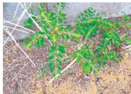
【ミドリ科】カサチグサ