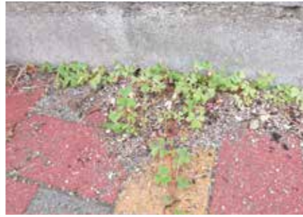
【ちょこちょこ科】ちょこちょこぐさ