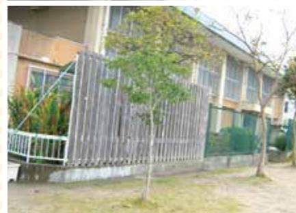
【いっぱい科】葉いっぱいの木