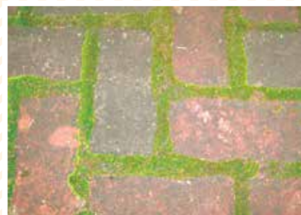
【かたこけ科】あみだくじ