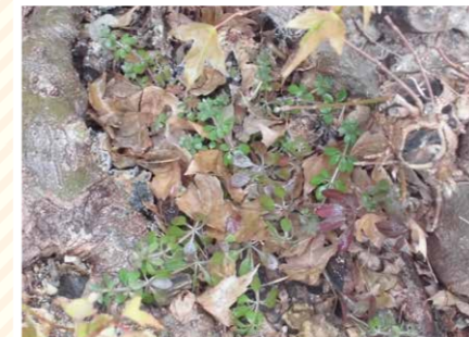
【木となかよし科】木草(きぐさ)