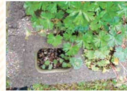
【ブロック科】三つ足