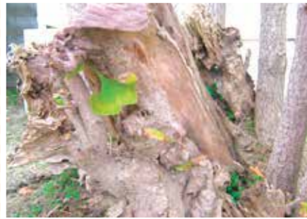
【友だち科】木のフレンド