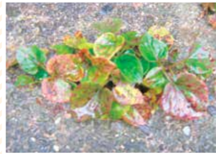
【ツチノコ科】ツチノコ草