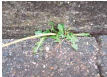
【へび科】ヤッホー出てきたよー