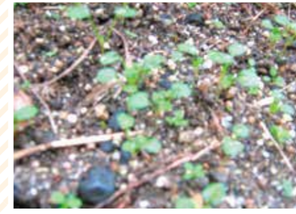
【ミニミニ科】ミニチョビ草