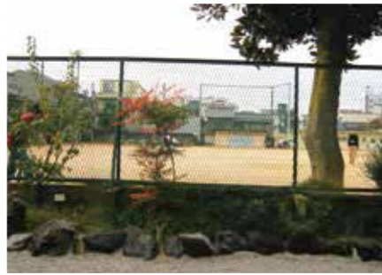
【色科】赤、緑の葉っぱの木