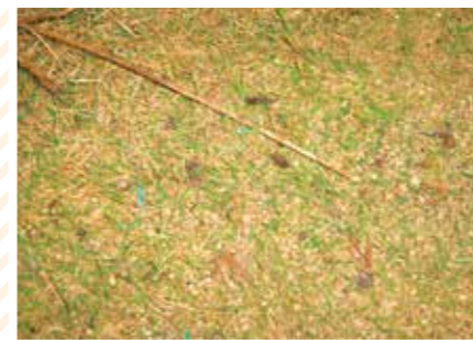
【ふしぎ科】ふしぎ森草