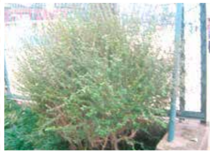
【もじゃもじゃ科】もじゃもじゃの葉