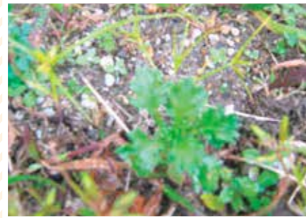
【人草科】赤ちゃん草