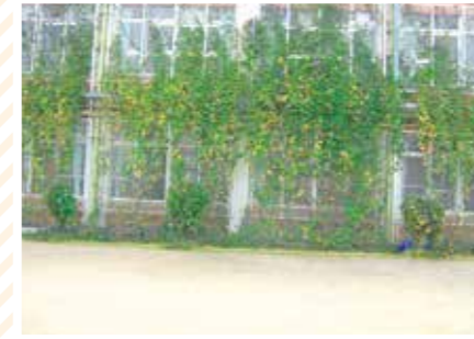
【のびのび科】どこまでのびるの？