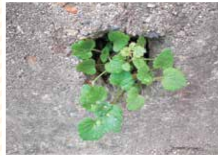
【あいさつ科】あなからコンニチハ