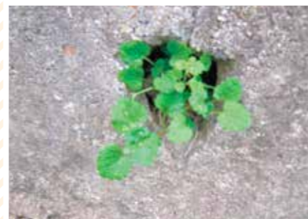
【アナのナ科】モアナグサ