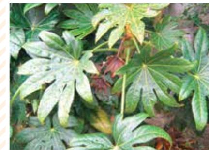
【しぜん科】うちわ草