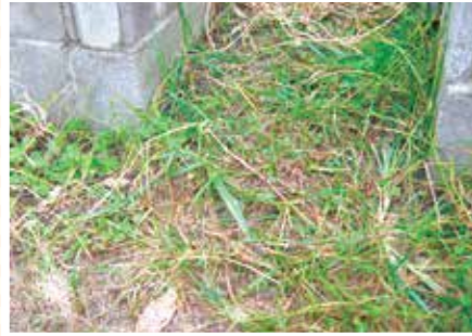
【モジャモジャ科】からまりモジャジャ