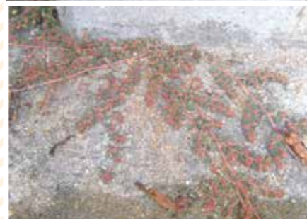
【のびのび科】元気にのびのび!!