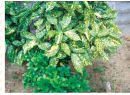
【ハーブ科】ミント草