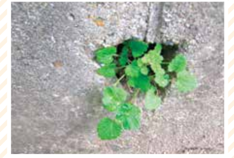
【アナ科】どこから来たの？