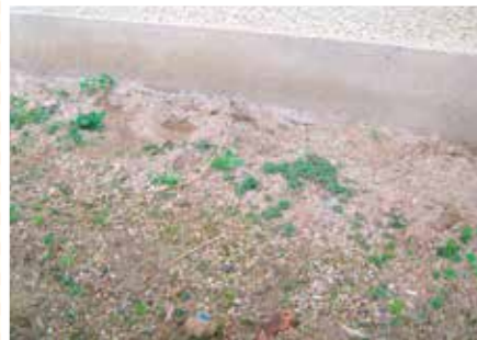
【なかよし科】なかよし草たち