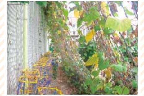
【トンネル科】みどりアーケード